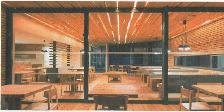
Mostschänke Sacher wurde neu gestaltet.

Foto: Haas Architektur / Mark Sengstbratt