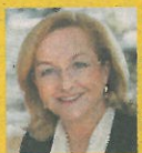
Bundesministerin Dr. Maria Fekter von 17:30 bis 18:30 Uhr GH Mandorfer Linzerstraße 34 4063 Horsching