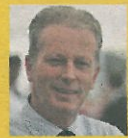
Bundesminister Dr. Reinhold Mitterlehner von 17:30 bis 18:30 Uhr GH Luger St. Marien 10 4502 St. Marien