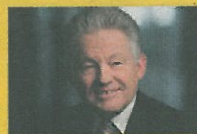
„Nur wer zuhört, weiß, wo die Menschen der Schuh drückt. Darum sind wir im Rahmen unserer Sprechtagsoffensive in Linz-Land für Sie da.“ Landeshauptmann Dr. Josef Pühringer