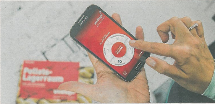
Am Smartphone kann man nun detailliert sein Pellets-lager planen.